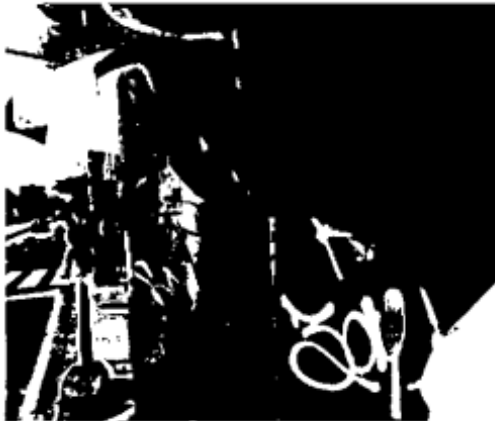
Quiosco ubicado en la Avenida Caracas con calle 37, donde se evidencia las afectaciones, por efecto del vandalismo y falta de mantenimiento.