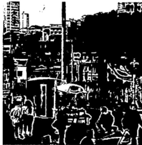
Quiosco ubicado en la carrera 2ª con calle 14, localidad de Candelaria, se encuentra ubicado en una zona de poca proyección para las ventas.