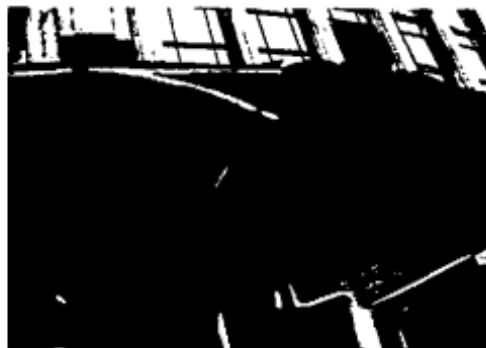
Quiosco ubicado en la carrera 8 con calle 14, afectado por accidente de tránsito en agosto 2011, el cual permanece sin arreglar